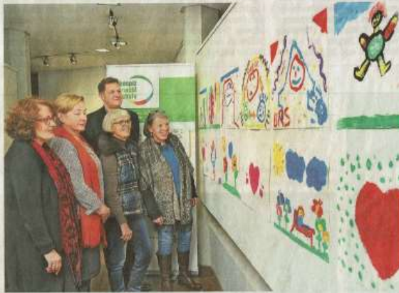
Bilder von Kindern, die sich mit dem Thema Tod auseinandersetzen, sind derzeit in der Ausstellung der Hospizgruppe im Rathaus zu sehen.

„Oben im Himmel kann man alle seine Hobbys machen“, ist eines der Zitate, die das Team der Hospizgruppe gesammelt hat. „Ich freue mich, dass wir Ihnen eine außergewöhnliche Ausstellung präsentieren können“, erklärte Kulturbeord-